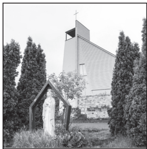
Église Notre-Dame-de-la-Salette 1016, boul. de la Salette Saint-Jérôme, Qc J5L 2J5