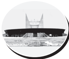
Notre-Dame-des-Prairies 37, 1er Avenue, Notre-Dame-des-Prairies