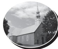
Saint-Paul 8, boulevard Brassard, Saint-Paul