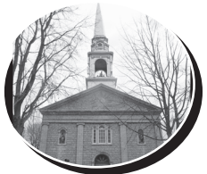
Saint-Thomas 830, rue Principale, Saint-Thomas