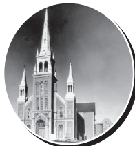
Cathédrale 2, St-Charles-Borromée Nord, Joliette