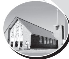
Sainte-Thérèse 720, St-Thomas, Joliette