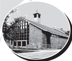
Christ-Roi 330, Papineau, Joliette