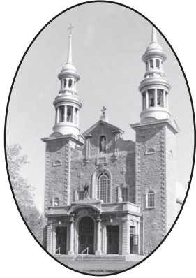
Saint-Rémi 840, rue Notre-Dame Saint-Rémi J0L 2L0 Tél.: 450 454-2133 accueil@parstremi.org