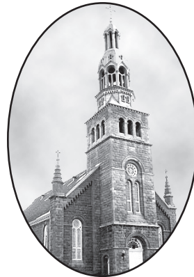
Saint-Isidore 673, rue Saint-Régis Saint-Isidore J0L 2A0 Tél.: 450 454-9872 paroisse_stisidore@hotmail.com

Site internet : www.unitepastoralelesjardins.ca Facebook : www.facebook.com/st.remi.st.michel.st.isidore/