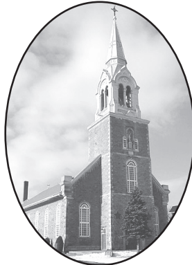
Saint-Michel-Archange 1786, rue Principale Saint-Michel Tél.: 450 454-2133 accueil@parstremi.org