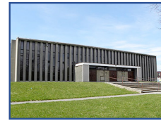
Église Saint-Justin 5055, Joffre Montréal, H1K 2T7