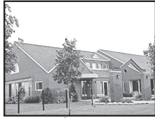
Église Jean XXIII 7101, De l'Alsace Anjou H1J 2X8

info@notredamedanjou.org www.notredamedanjou.org