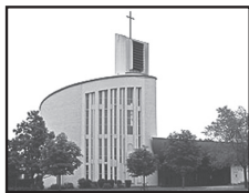
Église Notre-Dame-d'Anjou 8200, Place de l'Église Anjou, H1K 2B3