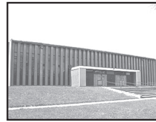
Église Saint-Justin 5055, Joffre Montréal, H1K 2T7