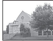
Église Saint-Conrad 6950, Des Ormeaux Anjou, H1K 2X6