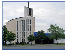
Église Notre-Dame-d'Anjou 8200, Place de l'Église Anjou, H1K 2B3