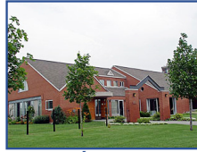
Église Jean XXIII 7101, De l'Alsace Anjou H1J 2X8

info@notredamedanjou.org www.notredamedanjou.org