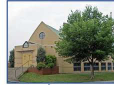
Église Saint-Conrad 6950, Des Ormeaux Anjou, H1K 2X6