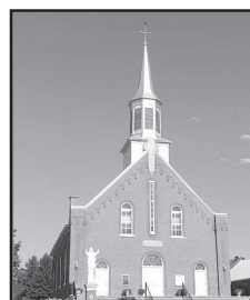
N.-D.-du-Mont-Carmel 1621, rue Principale 819 374-6526