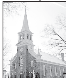
Ste-Jeanne-d'Arc 1050, 105 e Avenue 819 536-2641