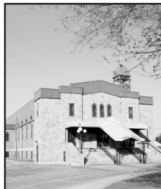
St-Sauveur Siège social 615, 123 e Rue 819 536-2655