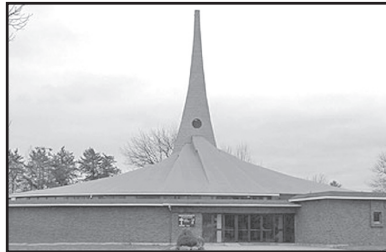
Église Sainte-Bernadette 760, rue Guilbert

Courriel : fabriqueperefrederic@hotmail.com