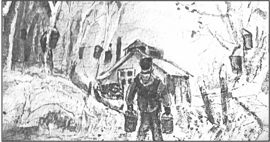
Sève de vie aquarelle

Ripon Paroisse Saint-Casimir Montpellier Paroisse Notre-Dame-de-la-Consolation Saint-Sixte Paroisse Saint-Sixte Saint-André-Avellin Paroisse Saint-André-Avellin