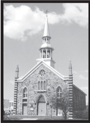
Fondation : 29 novembre 1856 Erection de l'église : 20 février 1857